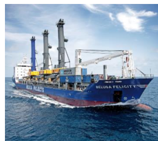
Sur le quai 2, le 28 mai

Le navire SENDA a embarqué les 4 ponts roulants en Irlande, les 3 grues et 3 super-stackers en Allemagne pour prendre la mer, coïncidant au jour même de notre réunion avec la Commission européenne à Mayotte. L'arrivée sur le quai 2 est prévue le 28 Mai prochain et c'est donc le « branle-bas de combat » pour MCG avec le chrono des formations : le simulateur et le formateur de la société LIEBEHRR sont en place, celui de la mise en œuvre du programme de gestion NAVIS avec une mission semaine 19 et enfin l'adaptation en cours des plateformes de stockages. Dans quelques semaines c'est donc un tout autre visage que le port proposera avec ce nouvel ensemble de matériel dont l'échelle hors du commun peut être appréciée dans les films LIEBEHRR projetés dans le hall de MCG. Ainsi, les ambitions préparées avec minutie seront pour ainsi dire posées concrètement sur le sol de Mayotte.