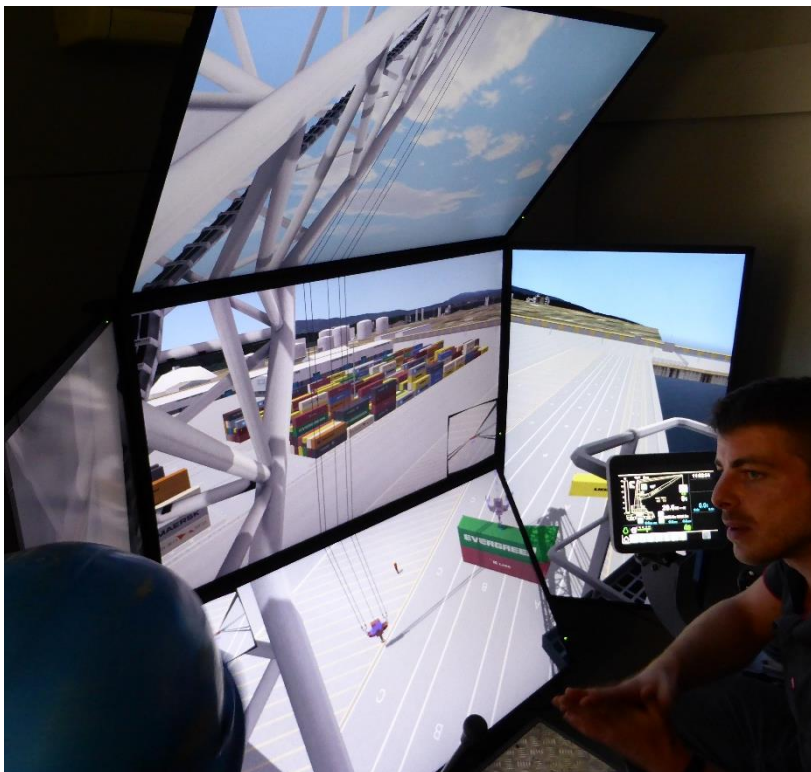
Le simulateur du poste grutier, une technique de formation totalement innovante offerte aux candidats.